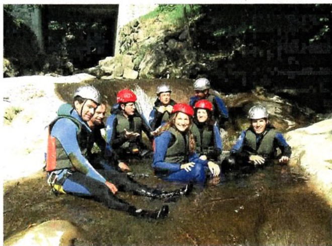
Page de gauche, vue aérienne de Villars-Gryon. Ci-dessus et ci-contre, ascension d'un glacier, via ferrata et canyoning avec le réceptif Villars Experience.

Ne pas manquer non plus les restaurants et auberges d'altitude pour la découverte des nombreuses spécialités locales (viandes séchées, raclettes, fondues, saucisses, viande des grisons, potée valaisanne, eaux de vie de fruits dont la célèbre abricotine, etc.). Ainsi que les traditions culinaires et dégustations œnologiques: l'héritage millénaire de la vigne en Valais, dû à un ensoleillement exceptionnel, suscite stupéfaction et admiration, au travers des 500 crus savoureux tels que le Fendant, la Petite Arvine, l'Amigne, etc.